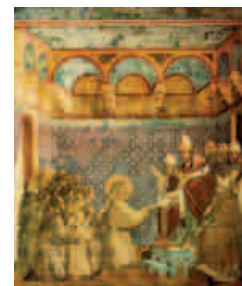
(Giotto - La conferma della Regola)

Si è parlato molto di San Francesco amico della natura e degli animali, certamente si è parlato poco di San Francesco amico degli uomini. L'amicizia di Francesco è un'amicizia libera. Verso ognuno dei suoi amici Francesco ha sentimenti ed atteggiamenti di meravigliosa tenerezza. Parlando degli amici usa espressioni di stima, che valorizzano l'altro, ne sottolineano le positività e ne rispettano la libera inventiva. Francesco è creatore di un'amicizia rispettosa e gode dell'originalità altrui. Nel suo modo di agire c'è la stupenda trasparenza di un affetto solidale, che riconosce l'altro come dono di Dio. Egli ascolta i suoi amici, convinto che lo Spirito Santo gli parli attraverso di loro e, nel momento decisivo della scelta tra apostolato e vita eremitica, si rivolge all'amicizia di frate Silvestro e di sorella Chiara e crede alla loro risposta. L'amicizia di Francesco, libera e rispettosa, eleva le persone e le conduce a Dio, perché l'amico possa incontrare Dio come lui lo ha incontrato.