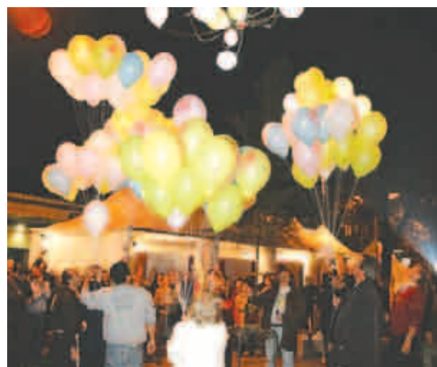
Un momento della Festa di San Francesco davanti alla Mensa dei Poveri

Grande e sentita anche la partecipazione alla tradizionale commemorazione dei nostri defunti. Sabato 12 novembre ci siamo riuniti nella Chiesa dei Frati Cappuccini di Viale Piave e, dopo la Santa Messa per i nostri cari, abbiamo ascoltato il Coro di Voci Bianche del Teatro alla Scala e del Conservatorio "Giuseppe Verdi" di Milano diretto dal Maestro Bruno Casoni, che ha eseguito musiche e canti corali di grande suggestione, che ci hanno permesso di prolungare il raccoglimento e la preghiera.