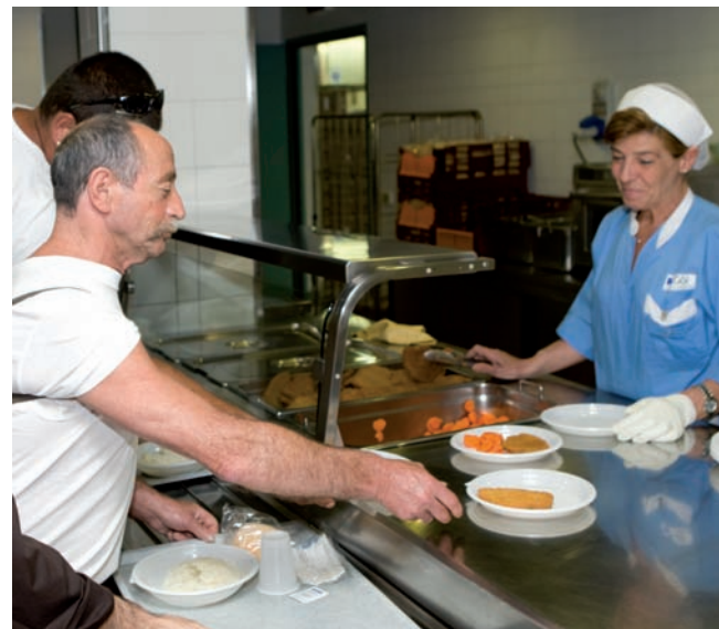
La Mensa continua ad essere un punto di riferimento indispensabile per i poveri che si rivolgono a OSF

Ogni numero, ogni prestazione offerta custodisce infatti sentimenti e relazioni, speranza e carità, valori che non potranno mai essere scritti in un bilancio, ma che sono e restano nel cuore di chi riceve e di chi fa dono di sé.