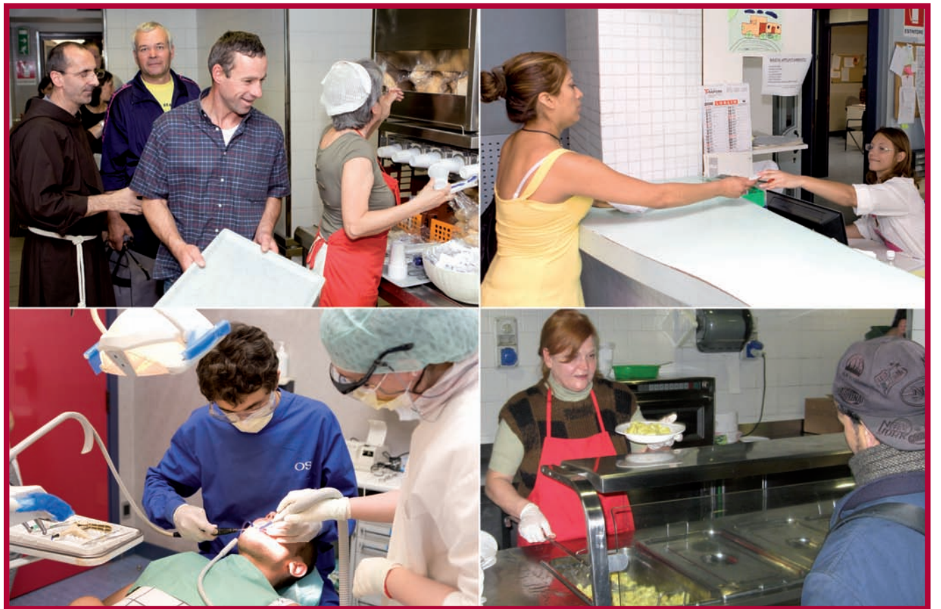
Grazie di tutto cuore ai volontari di Opera San Francesco che, con il loro impegno quotidiano, interpretano nel modo più autentico i valori della solidarietà e dell'amore per il prossimo.

Con la pubblicazione del resoconto delle attività si rinnova l'impegno di trasparenza verso chi ci sostiene e il ringraziamento per i 617 volontari che rendono possibile la missione di Opera