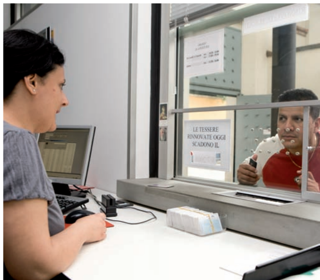
Opera San Francesco garantisce accoglienza, orientamento e aiuto materiale a chi non ha nulla