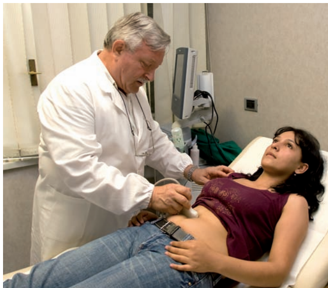
Assistenza, cure mediche e farmaci sono offerti gratuitamente a tutti i pazienti del Poliambulatorio