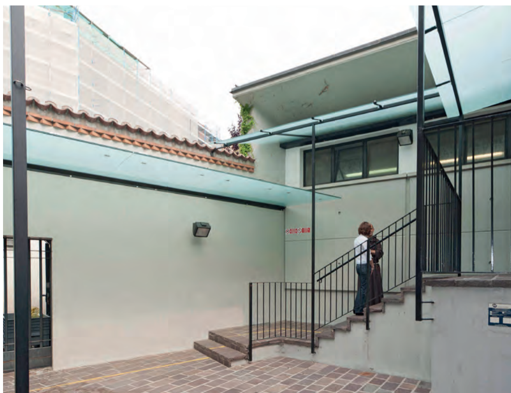
Anche l'ingresso alle Docce e Guardaroba è stato oggetto di interventi di adeguamento tesi a migliorare l'accoglienza delle persone che utilizzano il servizio