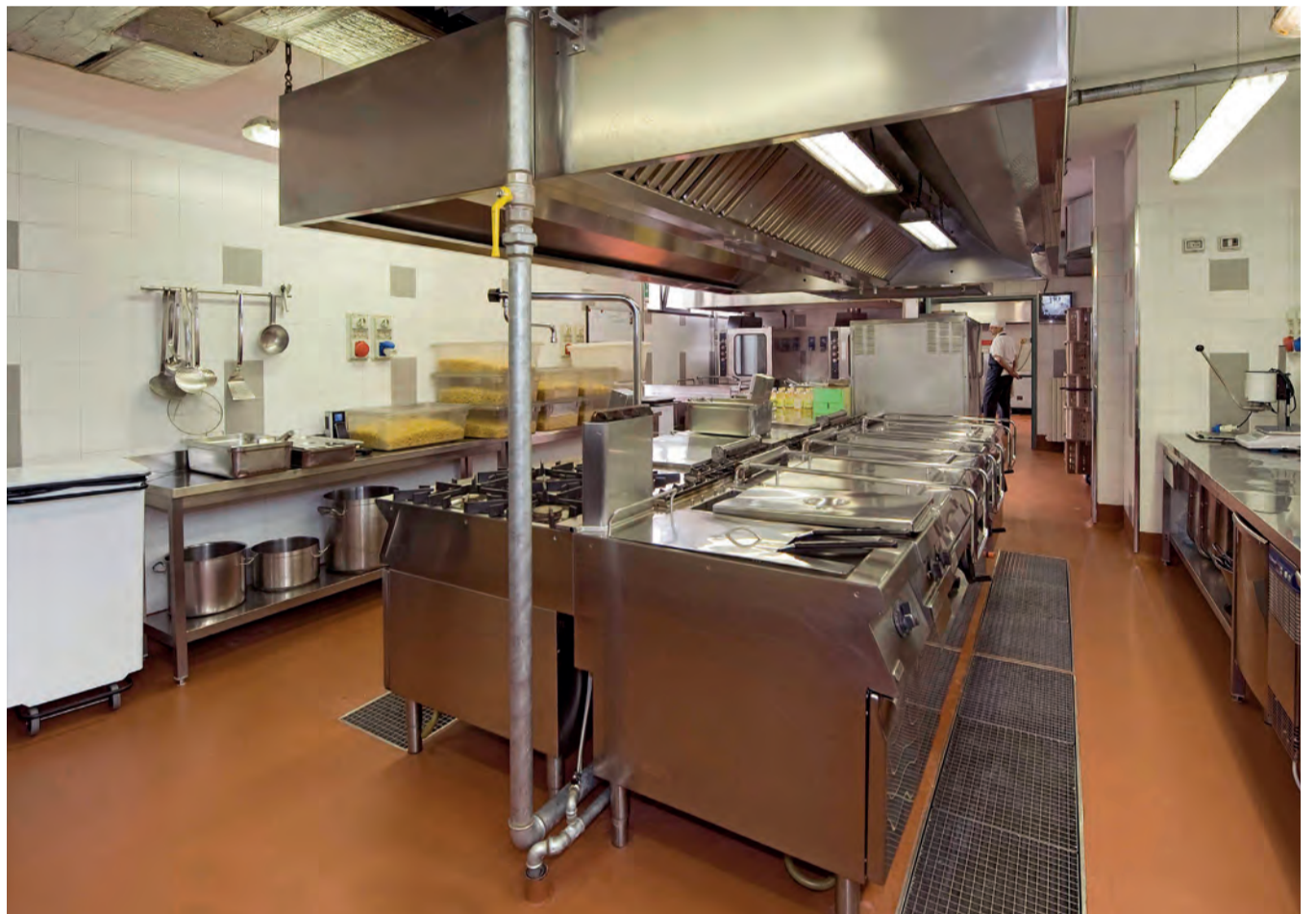
Una veduta della cucina dopo i lavori di ristrutturazione

Dopo il trasferimento dell'Ambulatorio, Opera San Francesco adegua alle esigenze delle persone più povere anche la struttura del nostro servizio più antico, conosciuto e frequentato: la Mensa dei Poveri di corso Concordia