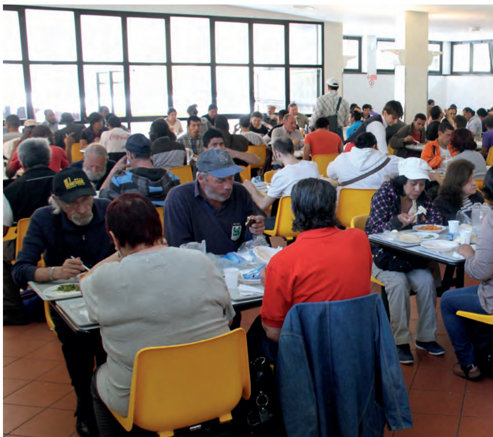
Sopra: L'affollatissima grande sala della Mensa