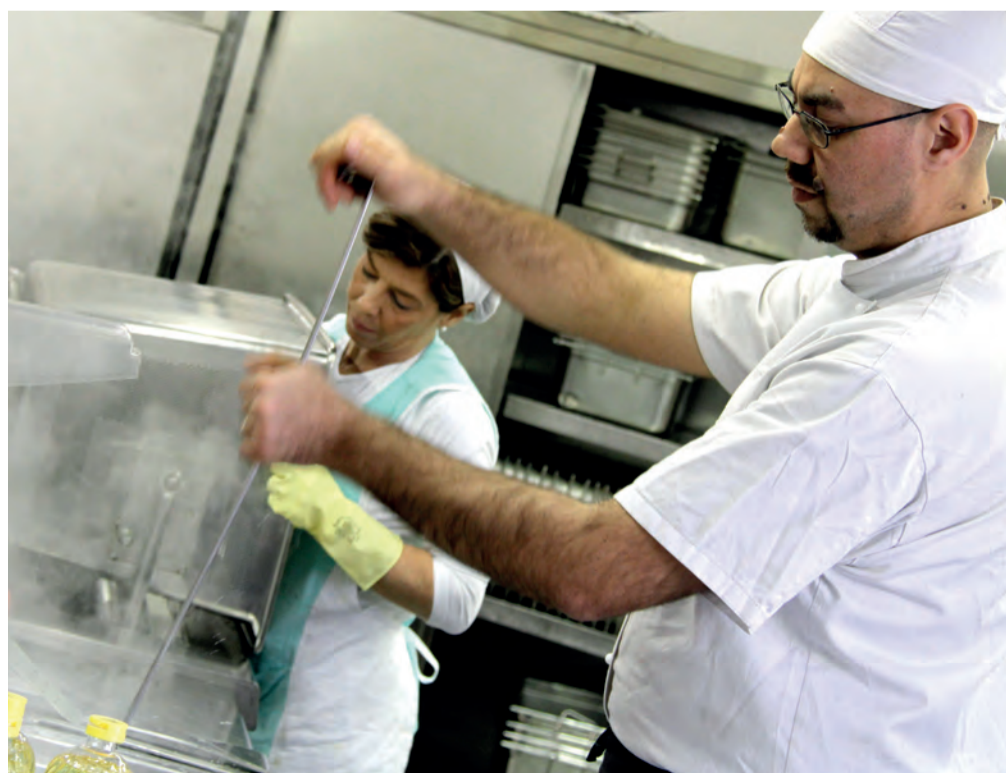
Il personale di servizio alle cucine, ogni giorno in piena attività per rispondere alle tante richieste di chi non ha nulla da mangiare

I nostri poveri sono tornati a sedersi a mensa, luogo sempre accogliente e piacevole e il panino è solo un lontano ricordo. ■