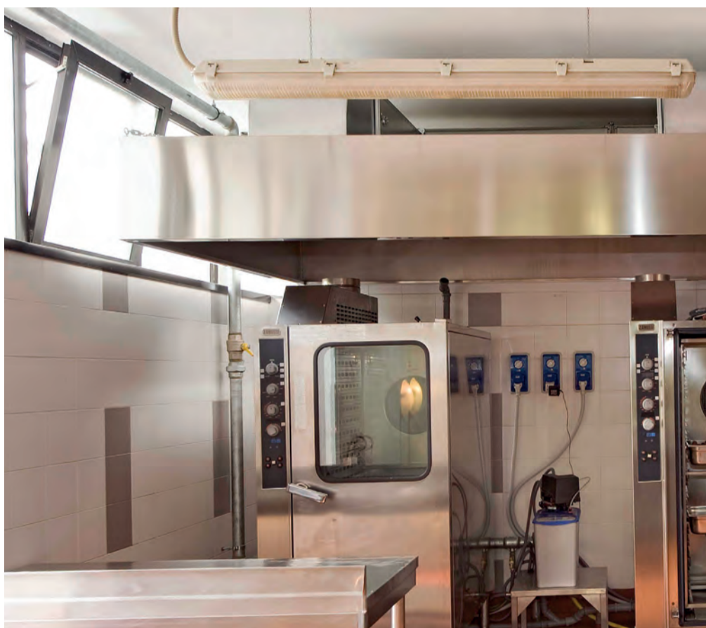
Sotto: I locali della cucina, oggetto di importanti interventi di ristrutturazione e di rinnovamento della parte impiantistica e della zona lavaggio