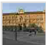
Monza: ora i profughi possono fare attività ...