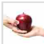
Monza: al Cam si parla di "Alimentazione del ...