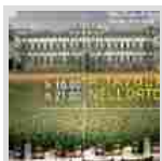
Monza: al via la quarta edizione del Festival...