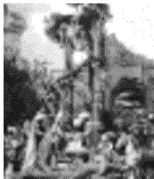
Presepi in mostra